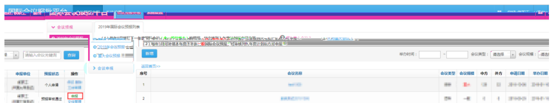
图 3.1 国际会议预报到申报

国际会议预报审核通过后，用户可以进行国际会议申报。步骤是：点击会议预报申报--》2019年会议预报--》进入预报列表点击对应会议操作栏中的“申报”按钮，如图 3.1，即进入国际会议申报流程。按要求填写国际会议申报表单后点击“提交”完成申报。