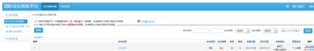
图 2.2.1 国际会议预报列表-文件管理页面

国际会议预报申请提交后，点击预报列表操作栏的文件管理，如图 2.2.1，进入 文件列表 页面如图 2.2.2，点击“ 下载 ”按钮 下载 国际会议预报申请表（部分内容和格式根据实际需要修改）， 打印签字盖学院公章扫描 后待用。