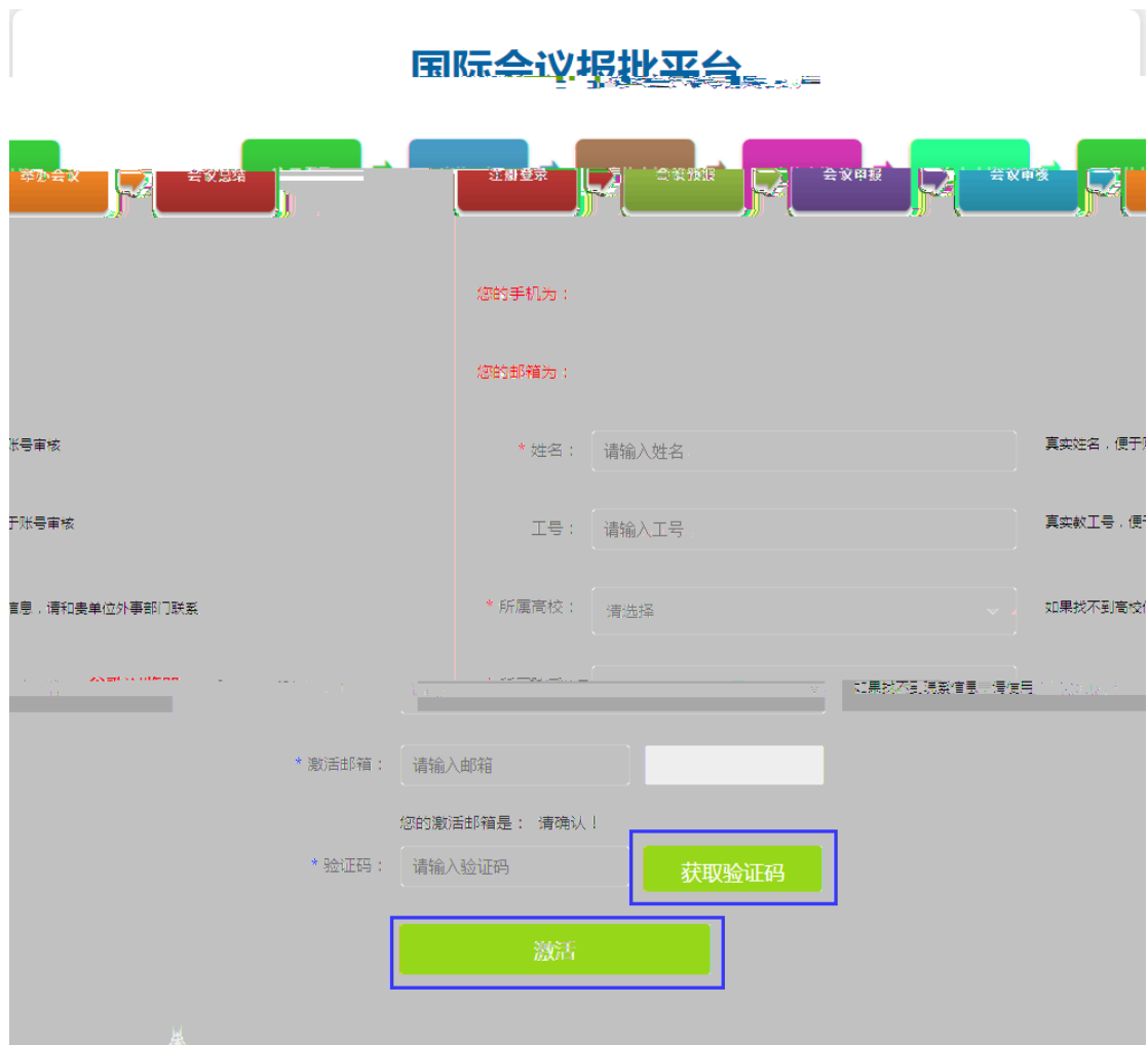
图 1.4 国际会议报批平台激活页面