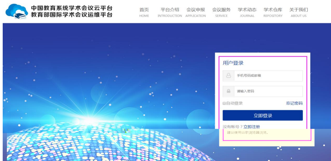
图 1.3 主平台登录界面

第二步： （注册成功后系统自动回到“中国教育系统学术会议云平台”）点击“登录”进入主平台登录界面如图 1.3，输入注册的账号和密码点击“立即登录”。