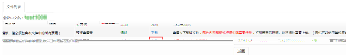
图 2.2.3 文件列表学院预报表上传页面

国际会议预报表 下载、打印签字盖学院公章扫描 后，需要将扫描件上传，点击“ 上传 ”按钮 上传 学院预报表（国际会议预报申请表签字盖章的扫描件），如图 2.2.3。 注：在单位初审审核之前可以修改上传的扫描件。