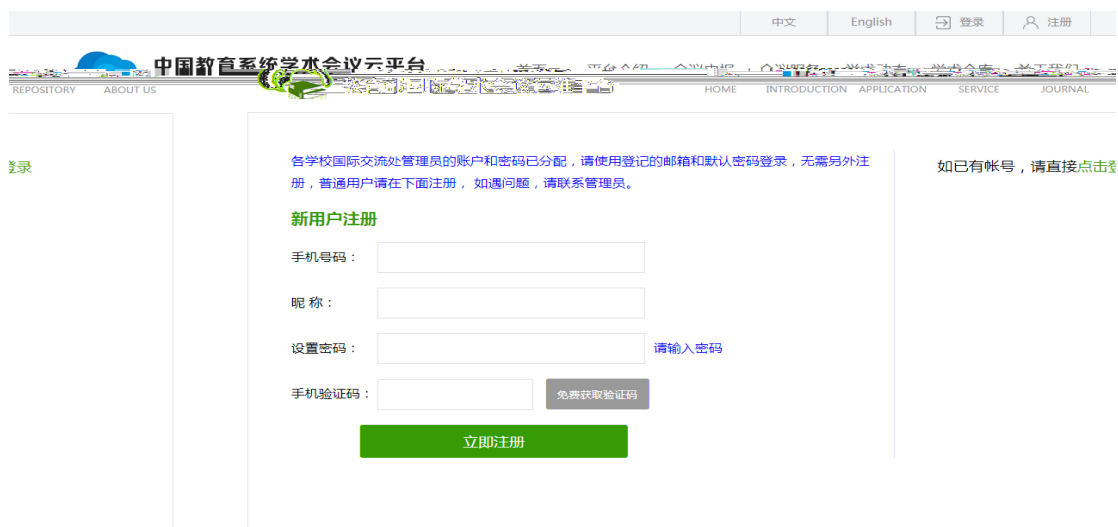
图 1.2 主平台注册界面

第二步： （注册成功后系统自动回到“中国教育系统学术会议云平台”）点击“登录”进入主平台登录界面如图 1.3，输入注册的账号和密码点击“立即登录”。